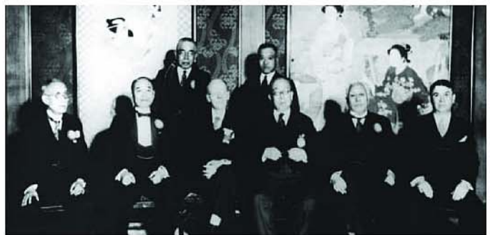
ポール・ハリス氏来日記念歓迎会。1935（昭和10）年。左から富岡常次郎、米山梅吉、鹿島精一、ポール・ハリス、小林雄一、徳川家達公爵、斎藤実前首相、ロバート・ヒル