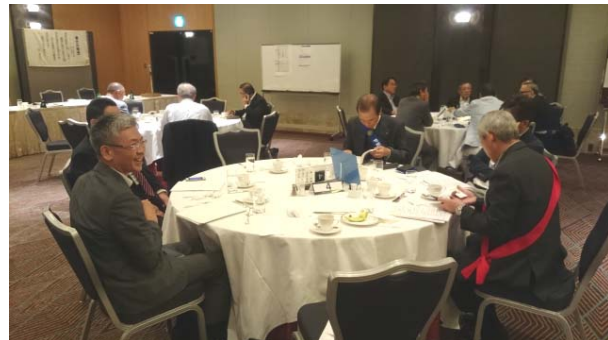
---アフターインフォメーション開催---