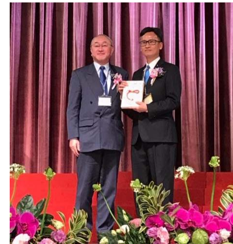
式典にて 高田会長よりお祝い金贈呈