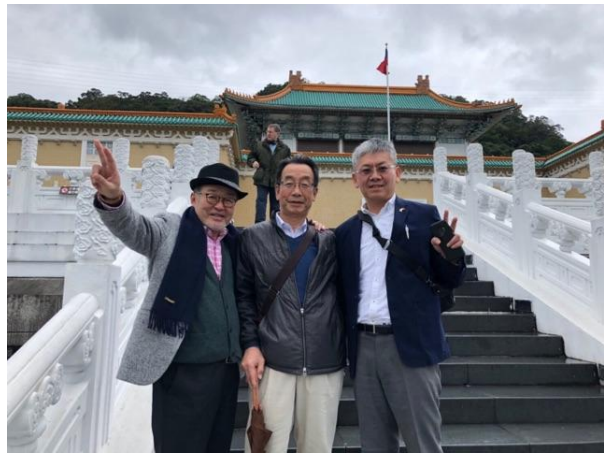
観光にも行きましたヨ！！（故宮博物院）