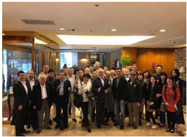
最終日 ホテル出発時も、大勢の方にお見送り頂きました。