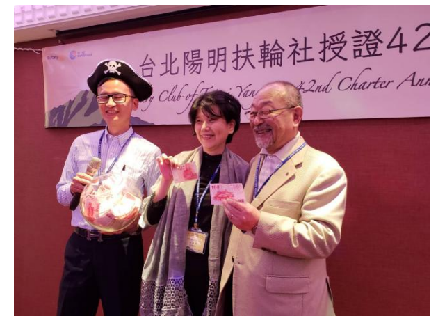
なんと！！ 郡会員が100名以上参加の大抽選会で商品の 大金を獲得！！