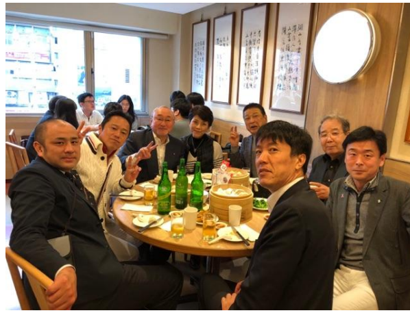
点心料理の超有名店「ディン・タイ・フォン」にて小籠包に舌つづみ！！