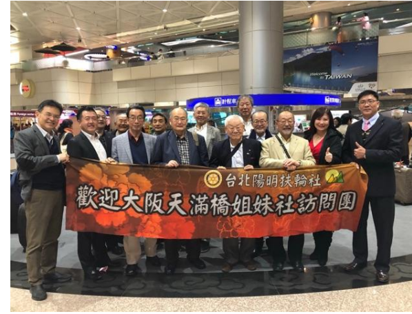
台湾桃園国際空港にお出迎え頂きました(第1班)